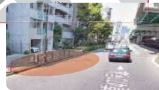
交差点・ガソリンスタンドの先です。