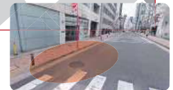
消防署の手前です。